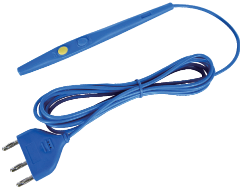
Manche bistouri électrique monopolaire